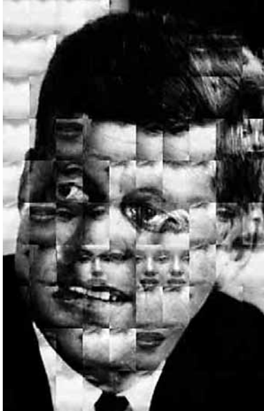
კომპოზიცია „კენედი – მერილინ მონრო“ ადამ ფინკელსტეინისა და სენდი ფარიერის ფოტოა. ეს გამოსახულება აგებულია მერილინ მონროს სურათის პატარა ნაკუნებისგან მესერის პრინციპით. ნაფლეთების განლაგება ეფუძნება ალგორითმს, რომლის მიზანი იყო ოპტიმალურად განლაგებინა ნაკუნები კენედის დიდი გამოსახულების მისაღებად. ალგორითმი ავტორებმა ორჯერ გამოიყენეს ორი განსხვავებული ზომის ნაკუნების ერთმანეთზე მოსარგებად. მიღებული ფოტოკოლაჟი ავტორებმა გამოფინეს 1994 წელს გამართულ ქსეროქს-პარკის ალგორითმული მხატვრობის გამოფენაზე.

სტერეოტიპებს ბევრი მოწინააღმდეგე ჰყავს. განსაკუთრებით, თვითონ პოლიტიკური ლიდერები აპროტესტებენ, თუკი მათი მიზნები გათვალისწინებულ ჩარჩოებს სცილდება. ტრადიციად იქცა, ასეთ შემთხვევაში პრესის გამოყენება განტევის ვაცის როლში. მედიას გაუჭირდა იპოვოს შემდეგი რგოლი, რომ ბრალდება „გადააბაროს“. თუმცა, რაც დათესა, ის მოიმკო. ყველა საკუთარ „ფრანკენშტეინზე“ აგებს პასუხს. წინასწარ შექმნილი აზრი საკმაოდ მყარია იმისათვის, რომ მათი შეცვლა მოხერხდეს. ამერიკული სტერეოტიპები კი უკვდავია, რადგან ხშირად ისინი რეალობის ხარისხს გამოსახვენ.