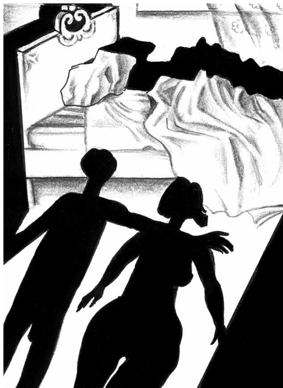
მხატვარი პადრი გაგნიძე

ლულუ შემობრუნდა და ერთმანეთს გაუღიმეს. რირეტი გაკიცხვითა და უხალისოდ ფიქრობდა დაქალის უშნო სხეულზე: მის პანანინა, შემართულ ძუძუებზე, პრიალა, გვარიანად ჩაყვითლებულ ხორცზე – როცა ეხებოდი, შეგეძლოთ დაგეფიცათ, კაუჩუკისააო – მაღალ ბარძაყებზე, მოუსვენარ სხეულზე, გრძელ კიდურებზე: „გეგონება, ზანგის სხეულიაო“, გაიფიქრა რირეტმა, „იმ ზანგს წააგავს, რუმბას [15] რომ ცეკვავს“. მოსრიალე კარებთან ახლოს რირეტმა სარკეში საკუთარი ტანის ანარეკლს მოჰკრა თვალი: „მე უფრო მოქნილი ვარ“, გაიფიქრა და ლულუს მკლავში მოჰკიდა ხელი, „როცა ჩაცმულები ვართ, ის უკეთესად გამოიყურება, ტიტველი კი, წყალი არ გაუფა, მე ვჯობივარ“.