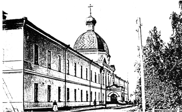
ვიატკის საავადმყოფო, რომლის ახლო სასაფლაოზეც დაკრძალა სოლომონ დოდაშვილი 1836 წელს

ჩემს მოვალეობად მიმანია სოლომონისადმი ვიატკის გუბერნატორის, კირილ იაკოვლევიჩ ტიუფიაევის, კე-