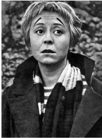
ჯელსომინა – ჯულიეტა მაზინა

ჯელსომინას სახელს არქმევდნენ თოჯინებს, სუნამოს, შოკოლადს და ვინ მოთვლის, კიდევ რას... არაერთმა