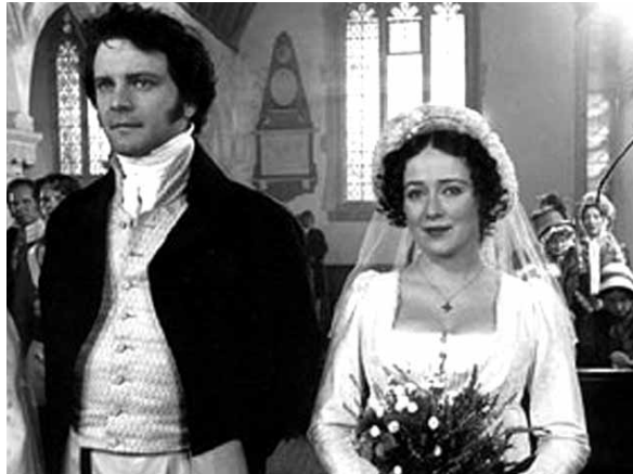
„სიამაყე და წინასწარწმენის“ სატელევიზიო ვერსია 1995 წელს შეიქმნა

უდავოა, რომ ამ წიგნების უმრავლესობა, რომლებსაც პირველად სასკოლო პროგრამიდან ვეცნობით, ჩვენს მუდმივ ფავორიტებად რჩება“.