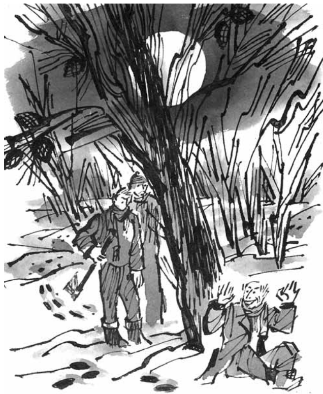
მხატვარი კარლო ფაჩულია

– აი, რა უნდა იყიდოთ, – ეუბნება მანი შვილებს, იოგუს და ალექსს, და ფლოტენბახელები გამოფენას ტოვებენ.