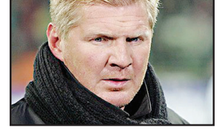
წარსულში სახელოვანი ფეხბურთელი შტეფან ეფენბერგი სამწვრთნლო საქმიანობა-

ში ჯერჯერობით ვერ აღწევს წარმატებას. ეფენბერგი ამჟამად 47 წლის არის და ბოლო პერიოდში ის გერმანიის მეორე ბუნდესლიგის გუნდის პადერბორნის მთავარი მწვრთნელი იყო. რამდენიმე დღის წინ პადერბორნის ხელმძღვანელობამ მიიღო გადაწყვეტილება ეფენბერგის დათხოვნის შესახებ, რაც გუნდის არადამკამყოფი-