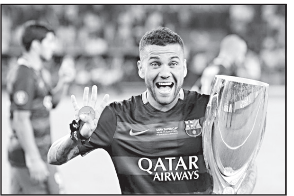
აღამიანი ვარ და მაქვს უფლება, მქონდეს ჩემი აზრი და ვთქვა ამის შესახებ.

სანამ დანიელ ალვეს და სილვა ბარსელონაში გადავიდოდა, 6 სეზონი გაატარა ესპანურ კლუბ სევილიაში. ანდალუსიურ კლუბში მან ორ-ორჯერ მოიგო უფასო თასი და ესპანეთის სამეფო თასი. პარალელურად ბრაზილიის ნარეშეშიც დაიმკვიდრა თავი, რამაც ბარსელონის ინტერესი გაამძაფრა და 32 მილიონ ევროდ შეიძინა. ალვესმა პირველივე სეზონში დაიმკვიდრა კატალონიური გუნდის ძირითადი და დღესაც უცვლელი წევრია და ბარსას ბოლოდროინდელ წარმატებებში უდიდესი წვლილი აქვს შეტანილი. ამასთან, საკლუბო ტიტულები კიდევ უფრო გაიმდიდრა და მათი ჩამოთვლა შორს წაგვიყვანს. ალვესთან ინტერვიუ ბარსელონის ვებგვერდზე გამოქვეყნდა.