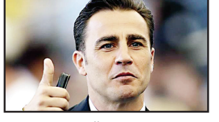
ეუსებო დი ფრანჩესკო, სწორედ ფაბიო კანავარო იქნება. კანავარომ კარიერა 2009 წელს დაასრულა და ის იტალიური ფეხბურთის ისტორიაში ერთ-ერთ ყველაზე ძლიერ მცველად ითვლება.

ლევენდარული იტალიელი მცველი ფაბიო კანავარო შესაძლოა სერია ა-ს გუნდის სასულოლს მწვრთნელი გახდეს. კანავარომ დიდი სურვილი გამოთქვა, რომ ის უახლოეს მომავალში რომელიმე იტალიურ გუნდს ჩაუდგეს სათავეში. ბოლო პერიოდში ფაბიო ჩინეთში მუშაობდა. სასულოლს ამჟამად ძალიან კარგად ასპარეზობს იტალიის ჩემპიონატში და გუნდი მე-7 პოზიციაზეა, რამაც კლუბისთვის უდიდესი წარმატებაა. სწორედ ამიტომ მისი მთავარი მწვრთნელი ეუსებო დი ფრანჩესკო შესაძლოა რანგით უფრო ძლიერ გუნდში გადავიდეს, ამიტომ სასულოლს უკვე ეძებს მის შემცვლელს, რომელიც, თუ იტალიურ პრესას და-