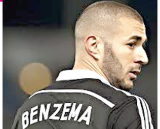
ამას მისი მეგობარი აკეთებდა, თუმცა კარმის ეს ინციდენტი ჯერ კიდევ ვერ აპატიეს საფრანგეთში და დეშამის გუნდში ბენჯემა ზედმეტია.

კარმ ბენჯემა ევროპის ჩემპიონატზე არ ითამაშებს. საფრანგეთის ნაკრების მთავარმა მწვრთნელმა დიდი დეშამმა განაცხადა, რომ ის ბენჯემას ნაკრებში გამოიძახებს არ ამირებს. — ბენჯემას ადგილი ჩვენს ნაკრებში არ არის. ის უმაღლესი დონის ფორვარდია, მაგრამ მის გამოიძახება არ ვაპირებ. ეს ჩემი გადაწყვეტილებაა და ამ