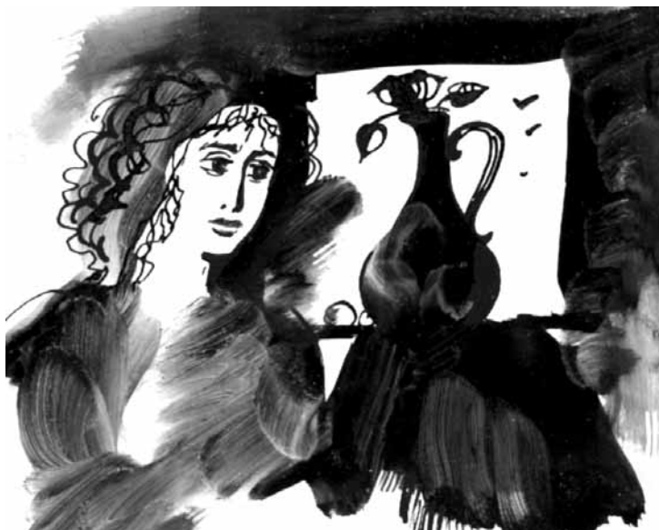
მხატვარი ნინო ზალიშვილი