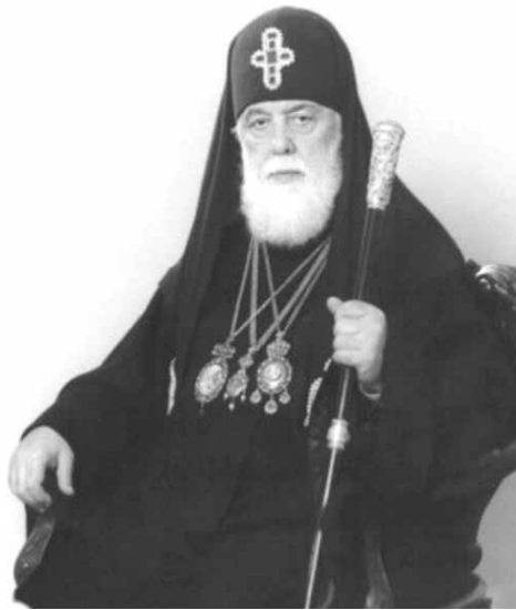
სრულიად საქართველოს კათოლიკოს-პატრიარქი ილია II

არჩევანი კი, რა თქმა უნდა, „ადამიანის უფლებათა დაცვის“ ამ ტოტალურ ხანაში, როცა მოვალეობებს საერთოდ აღარ ახსენებენ, რა თქმა უნდა, ჩვენზეა... (ამიტომ) კიდევ ერთხელ ვულოცავთ პატრიარქს დღევანდელ დღეს, ვუსურვებთ მხნეობას, გამძლეობას, ჯანმრთელობას, რითაც ამ გულწრფელი სურვილების მიუხედავად, პირველ რიგში, დიდი ანგარიშით, ჩვენ, ქართველები, უპირველესად ჩვენივე თავსა და ჩვენს სამშობლოს ვლოცავთ.