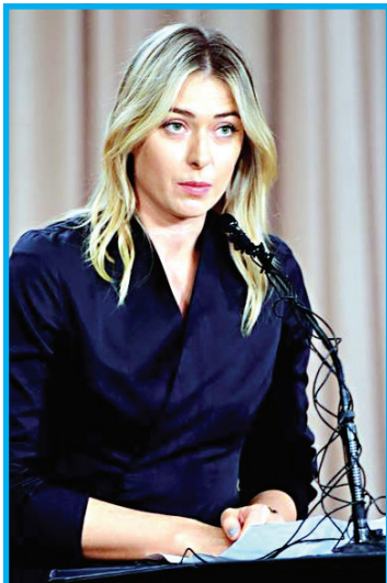
როგორც ჩანს, შარაპოვას ვერაფერი უშვლის, რადგან უკვე ზურგი აქციეს სპონსორებმა: მარიასთან კონტრაქტის შეჩერების შესახებ განცხადებითაა მიიღო „ნაიკმა“. ცნობილ ამერიკულ ბრენდს შარაპოვასთან 8-წლიანი და 70 მილიონ დოლარიანი ხელშეკრულება აკავშირებდა, რომელსაც ვადა 2018 წელს გასდებოდა. ასევე ხელშეკრულების გაგრძელება არ ისურვა შვეიცარიული საათების მწარმოებელმა კომპანია „ტაგ ჰეუერმა“, რომელსაც რუს ჩოგბურთელთან გასული კონტრაქტი 2015 წლის დეკემბერში ამოწურა და ახალი ხელშეკრულება სწორედ უახლოეს პერიოდში უნდა გაფორმებულიყო.

ცნობილ რუს ჩოგბურთელს, მარია შარაპოვას სისხლში აკრძალული პრეპარატი აღმოუჩინეს და გრძელვადიანი დისკვალიფიკაცია ემუქრება. ამის შესახებ განცხადება თავად შარაპოვამ გააკეთა და ლოს ანჯელესში საგანგებოდ დანიშნა პრესკონფერენცია: – უდიდესი შეცდომა დაუშვი, როდესაც აკრძალული პრეპარატების განხილვის სიაში მივიღე, მაგრამ მას სათანადოდ არ გავეცანი. ჩემი ქომაგების დიდი არმია დავალაღაღტე. ძალიან არ მინდა, რომ ჩემი კარიერა ასე დასრულდეს. იმედი მაქვს, რომ თამაშის შანსს მომიცემენ. იტვ-სგან წერილი რამდენიმე დღის წინ მივიღე და ამ საკითხზე ვმუშაობ. როგორც ირკვევა, სპორტსმენი რამდენიმე წლის მანძილზე იღებდა პრეპარატ მელდრონატს, რომელიც წელს აკრძალულია სიაში შევიდა. სხვათა შორის, ეს ის პრეპარატია, რომელზეც რამდენიმე დღის წინ 6 ქართველი მოჭიდავე ჩავარდა. თავად შარაპოვამ აცხადებს, რომ პრეპარატის მიღება 2006 წლიდან დაიწყო, როდესაც ჯანმრთელობასთან პრობლემები შეექმნა. თუ რუს ვარსკვლავს დოპინგის შეგნებულად მიღება დაუბრუნდება, კორტს 4 წლით ჩამოაშორებენ, ხოლო თუ ყველაფერი ისე იყო, როგორც მარია ჰყვება და საქმე მხოლოდ შეცდომასთან გვექონდა, მისი სასჯელი განახევრდება. შარაპოვას საქმის წინასწარი განხილვა 23 მარტს ლონდონში ჩაინიშნა. თუმცა, წინასწარი დისკვალიფიკაცია 12 მარტს იწყება.