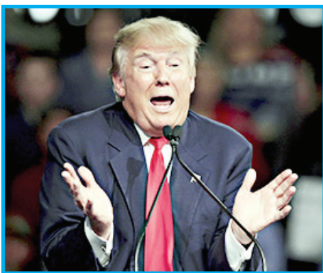
თუ ხელები პატარა მაქვს, მაშინ ერთი ორგანოც პატარა უნდა მქონდეს, მაგრამ გარანტიას ვაძლევ, რომ იქ ყველაფერი სრულ წესრიგშია, – განაცხადა ტრამპმა ტელედებატების დროს.

აშშ-ს პრეზიდენტობის კანდიდატმა ღონაღ ტრამპმა თავისი კონკურენტის სენატორ მარკ რუბიოს მიერ გამოთქმული ვარაუდი უარყო, რომელიც მისი მამაკაცური ღირსების ზომების სიმცირეს შეეხებოდა. მშენებლობის მაგნატმა ელექტორატი დაარსმუნა, რომ ამ მხრივ ყველაფერი წესრიგში აქვს. როგორც ერთ-ერთი ინტერნეტ რესურსი განმარტავს, რუბიომ ამგვარი ვარაუდი ტრამპის ფიზიოლოგიასთან დაკავშირებით თავის ამომრჩეველებთან შეხვედრის დროს გამოთქვა. – მისი (ტრამპი) სიმაღლე ექვსი ფუტი და ორი დიუმი. მაშინ რატომ, რომ ხელები ისეთი სიგრძის აქვს, როგორც ხუთი ფუტის და ორი დიუმის სიმაღლის ადამიანს აქვს? თქვენ ხომ იცით, თუ რას ამბობენ იმ მამაკაცზე, რომელსაც მოკლე ხელები აქვს, – განაცხადა სენატორმა. – მომინევს ამ თემას შეეხო. მან ჩემი ხელები გააკრიტიკა. აქამდე არავის არაფერი უთქვამს ჩემი ხელების მისამართით. შეხედეთ ამ ხელებს. ისინი პატარაა? მან (რუბიო) თქვა, რომ