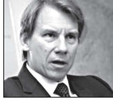
ნატო მხარს უჭერს საქართველოს, რომელსაც ჩრდილოატლანტიკურ ალიანსში განუვრიალება სურს. როგორც აზერბაიჯანული მედია იტყობინება, ამის შესახებ ნატოს სამედიაციო ოფისის ხელმძღვანელმა უილიამ ლაპიუმ ბაქოში გამართულ საერთაშორისო კონფერენციაზე, ნატოს ვარშავის სამიტი შეხვედრის შემდეგ და მოლოდინში განაცხადა.

– ჩვენი თანამშრომლობა რეგიონში ძალიან ძლიერი და სტაბილურია. რეგიონის სამივე ქვეყანა დაინტერესებულია ნატოსთან პარტნიორობის შე-