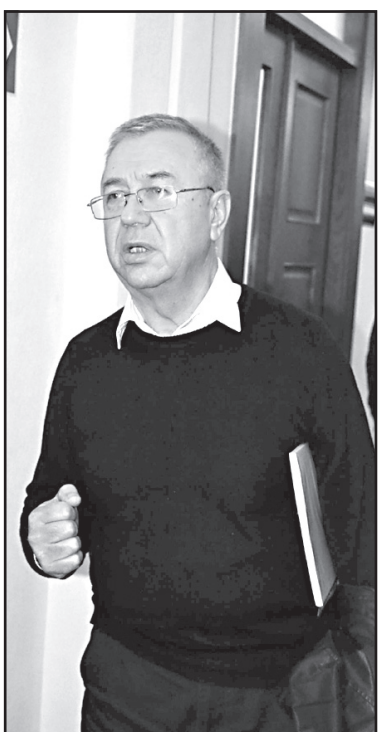
ბა ქუთაისი ტორპედოაო. ახლა რა შეიცვალა, რით აჯობა ტორპედომ რეალს?