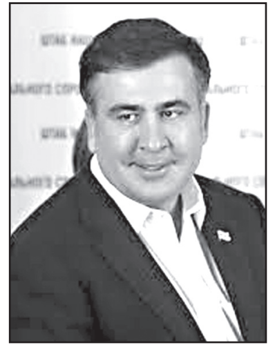
– სხვა ყველა, პროკურატურაშიც, სასამართლოშიც, პოლიციაში ხელმძღვანელ თანამდებობებზე ინიშნებიან ან წინა რეჟიმის აქტიური მხარდამჭერები, როგორც იყო მიქაუტაძე, შოთაძე და ა.შ. ან უკეთეს შემთხვევაში, ე.წ. ნეიტრალური ხალხი, რომელიც ასევე წინა რეჟიმის მხარდამჭერები იყვნენ, მაგრამ წინა პლანზე არ ჩანდნენ. ყველა უწყების ხელმძღვანელი პირი წინა რეჟიმის მხარდამჭერი იყო.