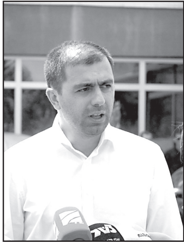
რაციის ხელმძღვანელი 2009 წელს. ის დაინიშნა შსს-ს სპეცდანიშნულების რაზმის ხელმძღვანელად. ეს არის დადასტურებული ფაქტი და ამაზე დღემდე შს სამინისტროს განმარტება არ გაუკეთებია.