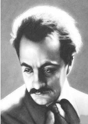
ჯიბრან ხალილ ჯიბრანი

ჯიბრან ხალილ ჯიბრანი (1883-1931) XX საუკუნის ცნობილი ქრისტიანი ლიბანელი ფილოსოფოსი, მწერალი, პოეტი და მხატვარი ჩრდილოეთ ლიბანის ქალაქ ბაშარიში დაიბადა. 11 წლისა დედასთან ერთად ემიგრაციაში წავიდა — ამერიკაში. ადრევე დაინტერესდა მხატვრობით. მისი პირველი გამოფენა 1904 წელს მოეწყო ბოსტონში. პირველი ლიტერატურული ნაწარმოებები არაბულ ენაზე შექმნა. 1918 წლიდან ინგლისურად დაიწყო წერა. ქართულ ენაზე თარგმნილია მისი პოეტური ესეები, რომანები, მოთხრობები: „მესაფლავე“, „წინასწარმეტყველი“, „წინასწარმეტყველის წალკოტი“, „იესო, ძე კაცისა“, „პოეტი“, „თვითმკვლელობამდე“, „ჩემი დაბადების დღე“, „მონობა“, „ხილვა“ (მთარგმნელები: გიორგი ლობჯანიძე, დარეჯან გარდავაძე, იზოლდა გრძელიძე, მანანა გიგინეიშვილი, ნინო დოლიძე, დავით გოგიბუაძე). აქ წარმოდგენილია ნაწყვეტი წიგნიდან „ქვიშა და ქაფი“, რომელიც იგავთა და აფორიზმების კრებულია. პირველად 1926 წელს გამოიცა ინგლისურად და მას შემდეგ მრავალ ენაზე ითარგმნა.