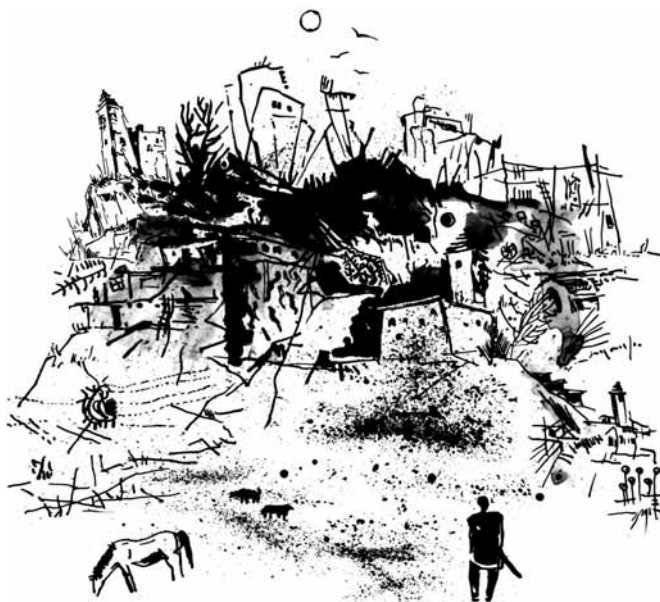
მხატვარი ბერდია არაბული

— ჰოო, მალედავ, 14 წინავ, სრულ კერპ ყოფილ, კიავ, მემრ არა. რავი მე, რაის ბედენაი ას? ან ჯვარ ას სრულ ყველა. უფალი ერთაი ას. მძლავრ გვეყოს, მკვიდრ გვეყოს! ჯვარს თავის სახელ აქვის: ბერბაადურგუდანის