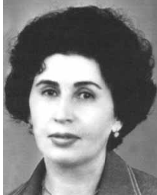
სხვა ვერ დაწერდა და ისე, როგორც სხვა ვერ დაწერდა. იგი წერს იმ კილოზე, რომელმაც ადამიანური სულის სიღიად შეაცნობინა.