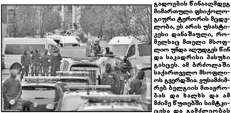
ვლადიმერ გიორგი კვიციანი...