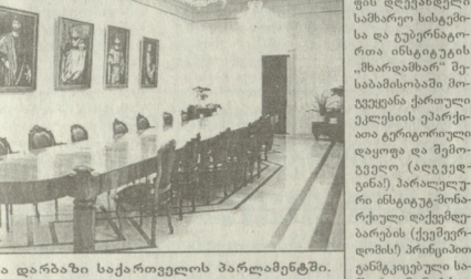
მონარქული რესპუბლიკის იმარკოვი, რომელიც XXI საუკუნის ინტელექტუალური...