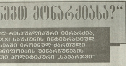
მონარქული რესპუბლიკის იმარკოვი, რომელიც XXI საუკუნის ინტელექტუალური...