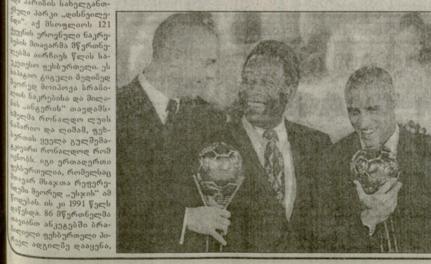
სტატიები... (Caption for the photograph showing a group of people.)

სტატიები... (Text discussing various topics related to sports and society.)