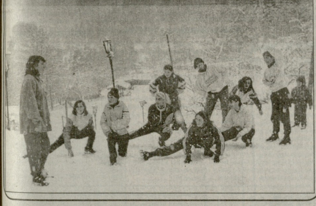
სპორტის განვითარებისათვის ჩვენი სპორტის განვითარებისათვის...