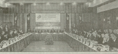
ფოტო: საქართველოს განსახლება ანერგეტიკული რესურსების ათვისების სახელმწიფო კონსეფსიის მიხედვით...