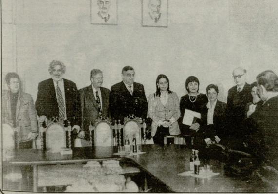
სემაროს მისი თბილისის სახელმწიფო უნივერსიტეტში