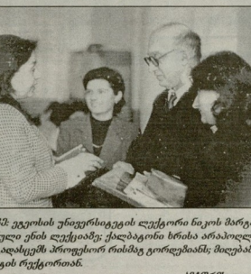
სემაროს მისი თბილისის სახელმწიფო უნივერსიტეტში