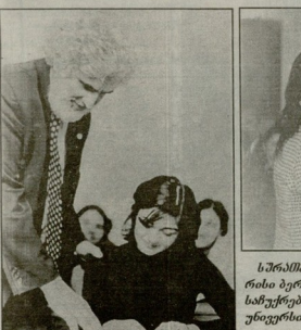
სემაროს მისი თბილისის სახელმწიფო უნივერსიტეტში