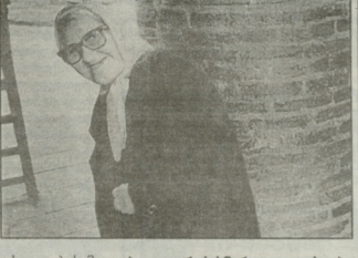
ბოლო დადგენი წინააღრე აბელ...