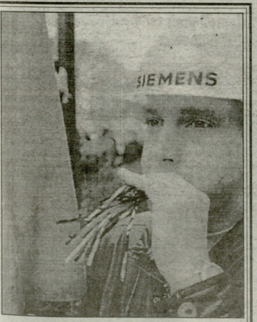
ცნობილი ვერმანული კომპანიის „სიემსის“ ასობით მოსამსახურებ და პროფკავშირთა წარმომადგენელმა მიიღო ვერმანიაში მთავრეხ სამართლებლო აქციები ფირმის მფლობელთა იმ ბუკებთან წინააღმდეგ, რომელთა მისანიბა სა-მუშაო ადგილების შექცირება.

შუბანსკენი 12 წლის განმავლობაში ვველაზე დაბალი დონეზე დავიდა დღობის წეღლი ნავთობის ლირბებულება. დღობის ნავთობის ბარბეის ფასბი, რომელიც ეროვგარო ირი-ექსირბო აზბის ქვევებში ექსპორტირბებულ ვველა სახეობის აბლობლოწე-ლური ნავთობისათვის, გუმინ ლონდონში 10,22 აშშ დოლარო შეადგინა. ექსპორტბო აზრბო, მხო-ვდობი ნავთობის ბაზარო ფსებობის ახალი კრბონს მზუნბო ეკონომბოლო უქ-რბობა აზბის მბოლო რრე ქვევენებში და ნავთობის წარბზარბობებო.