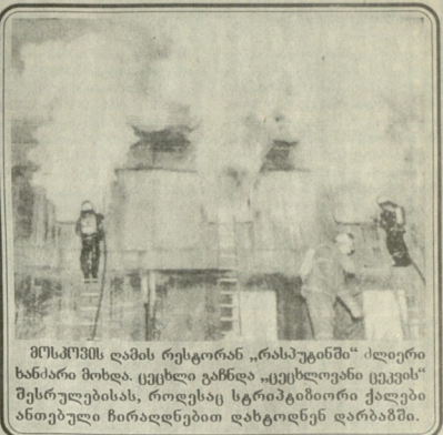
მოსამართლის დამის რესტორან „რასაკერნის“ ძლიერი ხანძარი მიხდა. ცეცხლმა განადგურა „ცეცხლგამი ცეცხლ“ შესრულებისას, როდესაც სტრუქტურული ქსელები ანთებულ ნივთიერებებში დაბრუნდა.