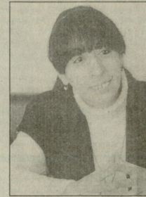
— ახლა მოგონებთ ჩემი...