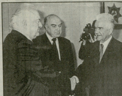
კარსაქვი (საქართველოს რეინტეგრაციის საბჭოს თავმჯდომარე) და სხვები.

ერანგული ბიზნესი საქართველოს ეკონომიკაში უფრო აქტიური მონაწილეობის სურვილს გამოთქვამს. საქართველოს პრეზიდენტმა კარსაქვიმ განაცხადა, რომ ამ ურთიერთობის განვითარებისთვის ურანგული ბიზნესების საფრთხილს უნდა შევქმნიდეთ. საქართველოს რეინტეგრაციის საბჭოს თავმჯდომარის კარსაქვის მიმდინარეობდა. საბჭოს წევრებმა განიხილეს საქართველოს რეინტეგრაციის საბჭოს თავმჯდომარის კარსაქვის მიმდინარეობდა.