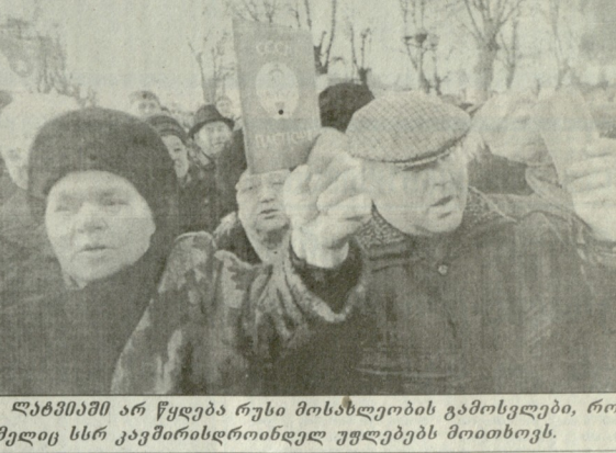
„ღანძრის“ არ წყდება რუსი მოსახლეობის გამოსვლები, რომელიც სსრ კავშირის დროინდელ უფლებებს მოითხოვს.