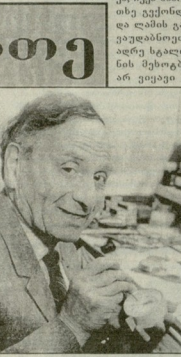
საპირის პროფესიის აღმავლობა...