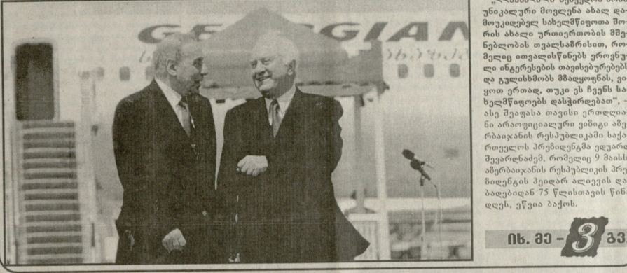
„საქართველოსა და აფხაზების შუამდგომლობა და თანადრომის წნეობრივი მაგალითი, რომელიც თვალსაჩინო იქნება მთელი რეგიონისათვის“