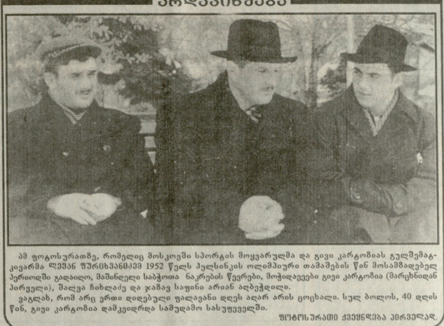
არდავიწყება. ამ ფოტოებზე, რომელიც მოსკოვი სპორტის მოყვარულმა და გვი კარგობის გულშემატკვარმა ლეონი ლეონიძემ 1952 წელს გადაიღო, მონაწილეობდა მისი მოსახლეობის წინაშე. მატჩში მონაწილეობდა მისი მოსახლეობის წინაშე. მატჩში მონაწილეობდა მისი მოსახლეობის წინაშე.