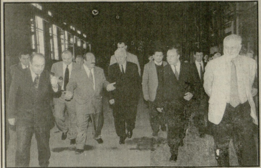
(პრეზიდენტი) ნამიბიში დაბრუნებული თითოეული დღისათვის 56 წლისა...