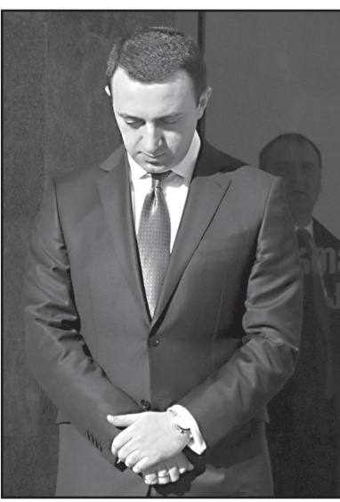
სალმებელია. მაქსიმალურად ყველაფერს გავაკეთებთ, რომ როგორც საარჩევნო სიაში, ასევე მათორიტარობის კანდიდატებად ქალებიც იყვნენ წარმოდგენილი, – აღნიშნა კალაძემ.

ასევე ქალებს ძალიან დიდ ყურადღებას ვუთმობთ, მიგვაჩნია, რომ რაც უფრო მეტი ქალი იქნება აქტიურად ჩართული პოლიტიკაში, მისა-