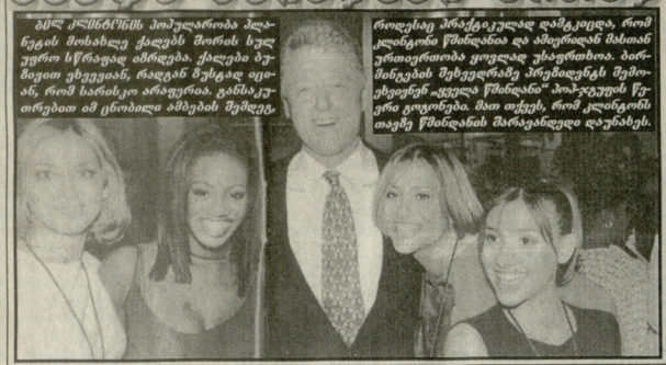
მძლავრნი პოპულარული პანორამის მისაღებად ქალების შორის ხელნაკეთი სწრაფად ახრდება. ქალები მუშაობენ ეხვევას, რადგან მსგავსად იყვან, რომ სარისი არაფერია. განსაკუთრებით იმ ენობლი ამბების შემდეგ.