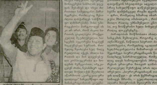
ისლანდიაში დაიწყო პოლიტიკური კლასი გათავისუფლება... ისლანდიაში დაიწყო პოლიტიკური კლასი გათავისუფლება...