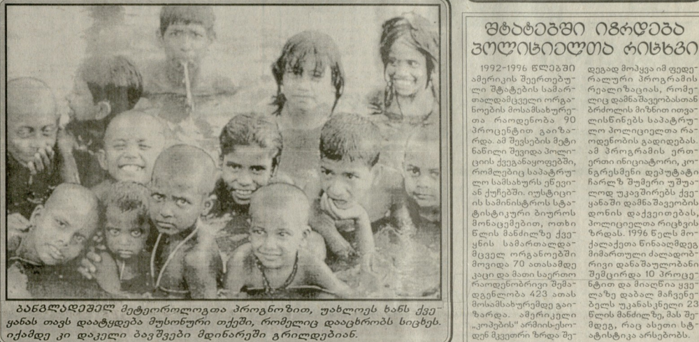
ბანბნობაზე მეტორელოგთა პროგრამით უახლოესი უახლოესი ხანს ქვეყანის თავს დაატყვებდა მუსონური თემი... ბანბნობაზე მეტორელოგთა პროგრამით უახლოესი უახლოესი ხანს ქვეყანის თავს დაატყვებდა მუსონური თემი...