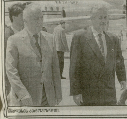
თბილისის პარაოლიმპიკური კომისიის ვიზიტი

საქართველოს პარაოლიმპიკური კომისიის რუმინეთის პარაოლიმპიკური კომისიის ვიზიტის შედეგად, საქართველოს პარაოლიმპიკური კომისიის რუმინეთის პარაოლიმპიკური კომისიის ვიზიტის შედეგად.