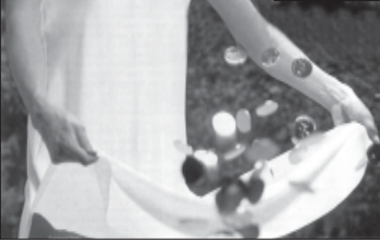
ფული ხელის მძლავრი რეაქცია