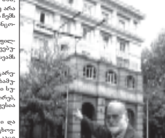
ამი ბავშვი, ამი ბავშვი, ამი ბავშვი...