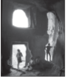
სპირსი ბინა-სინაბრა, XII-XIII სსსსსს.