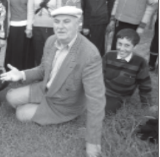
საშალო სკოლის დირექტორი, დამასხრუკვეთის უნივერსიტეტის რექტორი (საკეცადი რექტორი რესპუბლიკისთვის).