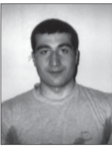
ზურაბ ჭავჭავანიძე.

ზით. 2. ჩაჯლობა შურგზე სიმბიით (სურ. 2). სრულდება 6 მისელა 6-6 გამეო-რებით. 3. აქტივა უარყოფითად დახრილ და-ფაზე (სურ. 3,4). სრულდება 8 მისელა 8-8 გამეორებით.