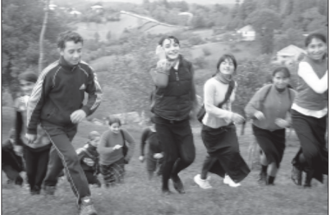
საშალო სკოლის მოსწავლეები.

დღეს კი უფრო გათქვა სახელი სოფელმა ცხრუკვეთმა. იგი ხომ ცხოვრებს ნაწილია ევროპაში ვეღვლები ახალგაზრდა პრეზიდენტის მი-