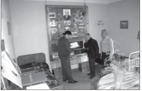
პროფესორი ა. სააკაშვილის ოთახი დიდი ბაბუის ნიკუშის წერეთლის სახლ-მშენებლის.