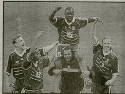
მათაშორის საფრანგული ნაკრები და სორბატი შეხვედნენ. მატჩი 2:1 შედეგით დამთავრდა.