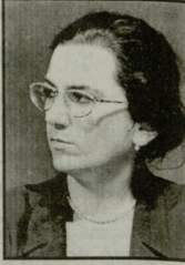
მინისტრთა კაბინეტის შემადგენლობა