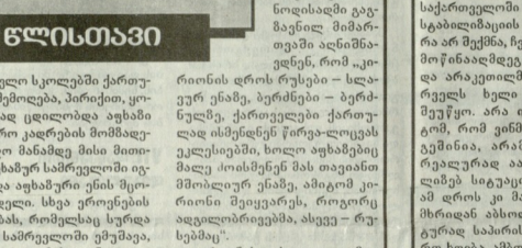
გიორგი II და აბესაძე