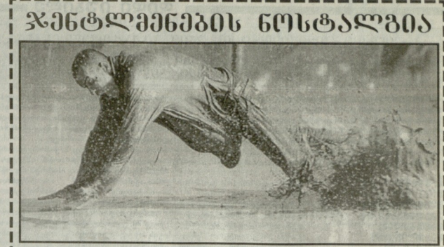
30000 კაცი შეიკრიბა დასტონბერში... 30000 კაცი შეიკრიბა დასტონბერში...

ლოა „დანიშნული“ ის იყო... ლოა „დანიშნული“ ის იყო... ლოა „დანიშნული“ ის იყო-