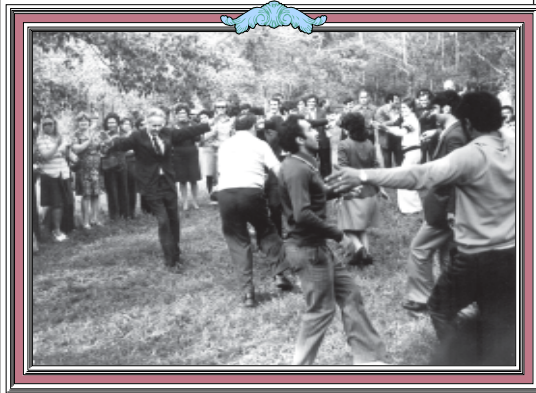
სამართო ტერიტორია „ეკლასრაიბე“ თანამშრომლები ერთდროსად ქალაქში გადმავლდა 1964 წელს. მოგვიანდ კი თბილისის მუნიციპალიტეტის სასახლის ახალი კომპლექსის ტერიტორიაზე გადასახლდა.