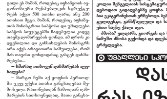
ნათო შარანი, რომელიც...