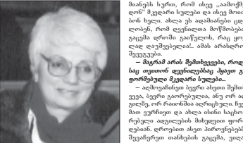
მამიკაძის სურათი, რომელიც...