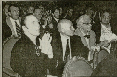
ბათუმის თეატრისა და ბალეტის თეატრის დასი