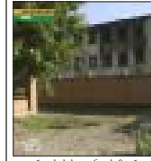
ინგუშეთის სახელობის მუზეუმის რეკონსტრუქციის პროექტი...