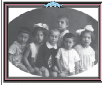
1000 დარქვის შედეგად სპეციალურ ფოტოაგენტთა მოედანზე და სურათი გადაღებული სურათები, ფეხსაცმელი, ბეჭდები - სამხ. ფეხმძლავლებს.

1941 წელს. მოგვიწოდებთ მინიმუმ ხარკს (თბილისი). ტელ: 39 66-10.