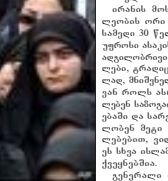
ბიზნისი რეკონსტრუქციის მიზნით სახლი კანდიდატი...