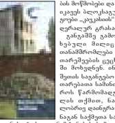
ინგუშეთის სახელობის მუზეუმის რეკონსტრუქციის პროექტი...