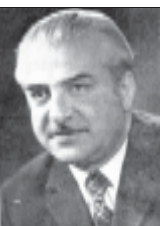
გული და გუბანი, ქუთაისს მუდამ აკანჭილებს... დიღუზნაგოზანი, კანჭივიტი კაცი...