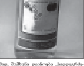
სოფლის მეურნეობის სპინისტრო ვაგაბშვილის მხარდაჭერის კონკურსის ჩატარების ინიციატივა გაუშვა