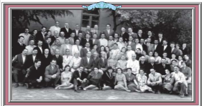
მომავლის სახელწოდებით უივერსიკეტის თეატრული ფაქულტეტის 1951 წლის კურსდამთავრებულები პროფესორ-მწიგნობრებთან ერთად. მწიგნობარ მამო იმერეთელმა. შეგახსენებ, რომ სურათების გაპროექტებმა უფასოა. ტელე: 99-66-10.