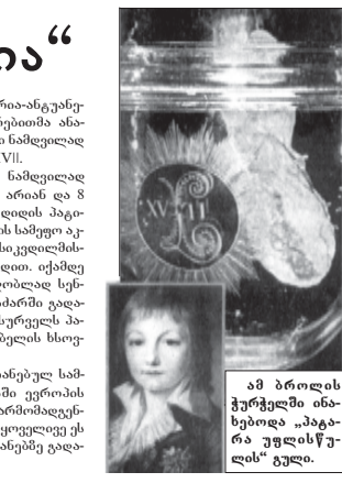
ამ ბროლის ქურტული ინახელის „აპაგრა უელსკულის“ გული.