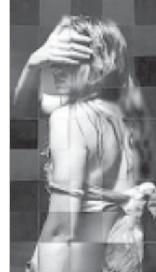
ბით თვეში სამუშაოდ 40 დღით... შესაძლებელია.