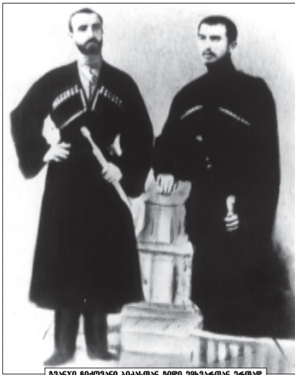
გვანჯი რიქოვანი მამამთან მამად ვანარეანი მამად.

ამჟამად ვადეკუწვივე, მოკლედ აღწერილი მთავარი მომქმეტი. აუტოიორგოიული შემოსხვევები, რაც ითავს ვადამხლოთია ჩემი ცხოვრების მანძილმე და ვადდეუქ შეეღებს, ვინაიდან ბუქნისა, წუთისოფულს თავისი კანონები აქვს - ვანჯებამ შეიძლება არ მოქმედს იმის საშუალება, შეიღებს