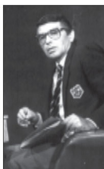
ბენერალია აღივნიებულია და სიყვარულია, სიყვარულია კი, თავის თავად, გმირობა!