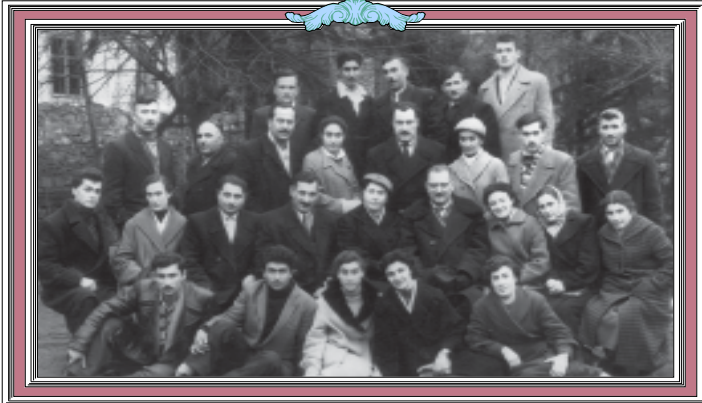
მხატვრული თეიმურაზის (თეატრული) კოლექტივის ხელმძღვანელი რესპუბლიკური კურსების მსწერელთა ერთი ჯგუფი ლექსირებას ერთად თბილისი, 1960 წელი.