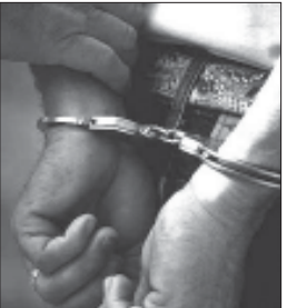
ცნობილია, რომ სხვადასხვა მიზეზის გამო ძალიან რთულია აიხსნოს...