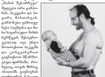
„მამის შენარჩევ“ შედეგად ორი გამომავალი, პაკეტი და პატარა ჩანსი. გამომავალი გამოიყენება დაავადების მართვით და კონტროლირებული ფარმაცეუტიკებით. როგორც თავის მხრივ, ანაბლის ვაგინების აღმოჩენის სპეციალური დახმარებით. ერთი კვირის შემდეგ ფრმა „ელექტრონული ფისკით“ შეატყობინებს დაავადებულ მამაკაცს, აქვს თუ არა მას რაიმე კავშირი ჩველის დაბადებასთან.

მთავარი განსაკუთრებით სპეციალური მოწყობილობა, რომლის მეშვეობითაც სწრაფად შეიძლება დაივადონი, თუ ვინ არის დაავადებული. გამოიყენება ამგვარად, რომ 99,9 პროცენტით განიკურნებულა სწორი მედიკამენტებით და აპარატის ფასი 700 ევრო.