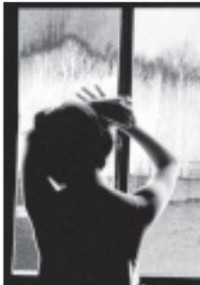
საქონლი, იქნებ შენი პაგარი არც გეულის კითხვას? სიმ იგი, ბავშვს არ ელა...