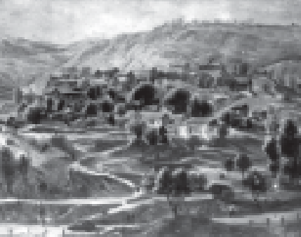
რედაქციის მთავარი, „საპარტიო“, 1940 წ.