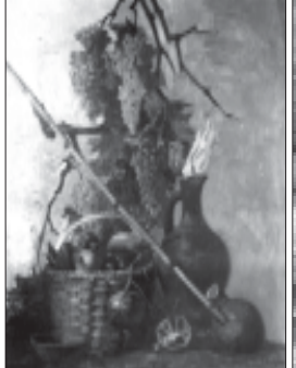
საპარტიო მასობრივი, „საპარტიო“, 1960.