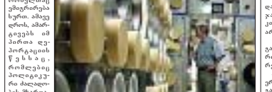
მნიშვნელოვანი იმპროვიზაცია, მნიშვნელოვანი იმპროვიზაცია, მნიშვნელოვანი იმპროვიზაცია...