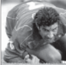
სპორტსმენი: პორტუგალიელთა კაპიტანი ლუი ფიტსი ნახევარფინალში – პორტუგალია-პოლინდია – თავისი საუკეთესო მატი თამაშმა. საბერძნეთი-ჩეხეთი – 1:1+1 წუთი, გრანთანს დელასის გოლმა საბერძნეთის ნაკრები ჩემპიონატის ფინალში გაიყვანა.

1964. ესპანეთი – საბჭოთა კავშირი 2:1. 1968. იტალია – ივლის-ღვინა 2:0. 1972. გერ – საბჭოთა კავშირი 3:0. 1976. ჩეხოსლოვაკია – გერ 2:2 (პენ. 5:4). 1980. გერ – ბელგია 2:1. 1984. საფრანგეთი – ესპანეთი 2:0. 1988. პოლინდია – საბჭოთა კავშირი 2:0. 1992. დანია – გერმანია 2:0. 1996. ვერმანია – ჩეხეთი 2:1. 2000. საფრანგეთი – იტალია 2:1. 2004. პორტუგალია – საბერძნეთი ?