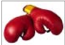
30 იელისს ლუისეილში (აშშ, კენსკი) უნდა გამობრობოს „რეინის მაცი“ ორთაბრძოლა დიდბრინდელ დანი ულაიამთან, როგორც თავად პრემიონის შერჩეველ მოქმობის, ტაისონის რაღაც დიდი სეროზული სამომავლო ვეგებთი აქვს. ექნება სულ მალე ჩემპიონის ტიტულსიაციის გერაინელ ვივაგვი კლბისთვისაც უბრძოლოს.

შხანგ მხოლოდის ჩემპიონის – ბრანდევხს ნაკრების სურს მატიის გამოვლენა პატივზე, სტადიონზე შესასვლელი ბილეთები კი იარაღზე გაიყვებთ. ჯერჯერობით მატი დანიშნულია 18 ავესტოსისთვის, როგორც იგეპობენის, შეხვედრებზე დასწრების აპირებს ბრანდევხს პრემილენი ლუიმ იგანილო და სხვადა... მატიის ბილეთებზე იარაღის გაყვლა კი ერთი კვირით ადრე დასწყება. როგორც ბრანდევხს სპორტის მინისტრმა განცხადებ, პატივს ვერ-