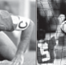
პორტუგალიელთა კაპიტანი ლუი ფიტსი ნახევარფინალში – პორტუგალია-პოლინდია – თავისი საუკეთესო მატი თამაშმა. საბერძნეთი-ჩეხეთი – 1:1+1 წუთი, გრანთანს დელასის გოლმა საბერძნეთის ნაკრები ჩემპიონატის ფინალში გაიყვანა.