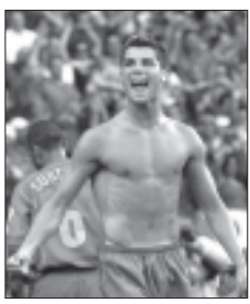
ბრა დეო ბექემსეულად მოუმაგებლა თამაშში, არავის აუკებდა. და ეს „ვერო“2004-ში ნათლად გამოჩნდა. ჯერ მარტო პოლინდიელებთან მის მიერ გაგანილი გოლი ხომ „უმაღლესი პოლიტიკის“ განხეკეთუენება, ბრანდევხს უნივერსალურ ფეხბურთელად ჩამოყალიბების ყველაზე მეტად „მანჩესტერ იუნაიტედის“ მწვრთნელ ლექს ფერდინანდის სჯერა. ამასთან, ქალველის გულმინდად ვენებია, ამის სანქცია ბრანდევხს გამოყოფა ჟორდანი ბრანდევხს რომინა გახორდა. რაც შეეხება დიდიხილვა სქინიას, მას უბრალოდ დაკამრთლა, რომ 10 წლთი ადრე დაი-

მოდს არ აზარებენ ბექემს (სწორედ მისი შეხვედრით ნორით გამოდის ახლა „მანჩესტერ იუნაიტედში“), ფიტსუკი, რომლის მხარდამხარია თამაშის ნაკრებში, ფორვარდ სხინის მადრიდის „არეალიდან“. თვით ბრანდევხს კი მრავალჯერ განუცხადებია: „არ მინდა, რომ ეინმეს ვგაბდეო“. ერთმა კენსლერ მალეიარს (პირველადმოქმედებმა წაბლისა და დღეს უმარმამარი სეები რომ ნახეს, გაიყვანებმა წამოიხსენ: „მადური“, რაც „ტექს“ ნიშნავს), შით ხანვე მინდრებზე გაბარა, შეიღო წლიდან იქაურ „ნაისონაში“ თამაშობდა, პორტუგალიის ამ პროინციიდან თინეკური ბრანდევხს (მშობლებმა ეს სახელი ამერიკის პრეზიდენტის ბრანდევხს რეიგანის პატივსაცემად დაარქვეს) ლისბონის „სპორტინგის“ საფეხურით სკოლაში აღმოჩნდა. 15 წლისამ პირველად თამაშმა პორტუგალიის ჭაბუკთა ნაკრებში, 17-სამ „სპორტინგის“ შემადგენლობაში, 18-ისა კი ქვეყნის მთავარი ნუნსის შემადგენლობაში მოიხატეს. თანამაგობის მაგნი „მაისინაში“ თამაშის ყველა შედეგა მუროვ გამოხატა მინდორზე გამიჩნეულ ბრანდევხს ოქტობრად, – წერდნენ ვაშეთები, 18 წლის ყმაფილისთვის კარგი დეიბუტი იყო.