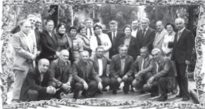
მზაში, 1951 წლის სკოლადამათერებლების შეხვედრა. 1983 წლის 22 თებერვალი. მოგაწოდა რამზა ბერუაშვილი.