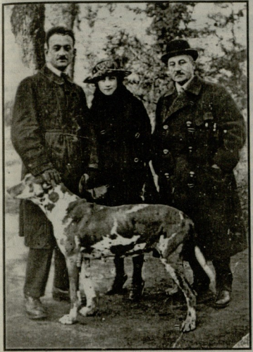
პიროლ მამუკის გროული ნადირობისადმი საყვირ-ლოლოდ ცნობილია. მის საყვირთესი ჯიშის რამდენიმე მონადირე ძაღლი ჰყოლია.