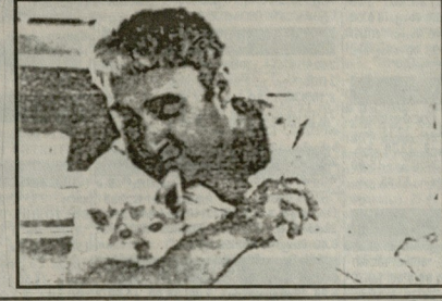
ბარბს მონსბანტინა ბამსბარლასი კი ყოველთვის, ახალგაზრდობისი და შემდგომ, ხანში შესვლის დროსაც, თანბარდა უხალისებობა და საბომბუნება ამ მკვიან ცხოველებთან ერთობლობითა.

2060 წლის რეზიბის შემოქმედების იტონის, მან კარვად იყის მისი დამოკიდებულება ძაღლებთან. როგორც მუშარაძე პუბანსის, ერთნაირად უყვარდა ეს მკვიანი თხოვებები, მიუხედავად იმისა, რომელი „ჯიშისა და გვარისა“ იყო ესა თუ ის ძაღლი. ვაგისხებით ნოღარ ღუმბამის შესანიშნავი მოთხრობის „ძაღლი“ ფინალი: ... სოველ ვაგებუე. თბიდან ეკაბლი ამოლიდა თორე ბოლქვებელ. მამბლები ყოილენ, ძროხისი ბლიოტენ, მხეხი პეგობობდენ, თბენები კიკინდენენ, ქობინები ერთბობდენ, კონსოლოტენ ურეკებულად მზე მუშინბგარიყო... ურეკ სხეულე სითბობი ამბესი და ურრბეში სახისამოგო მარამ დარეკა, ჩემს უმთბი ძაღლი ყველა...“ სრამბა – ნოღარი თავის „გემბისთან“ ერთად.