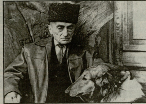
ბარბს მონსბანტინა ბამსბარლასი კი ყოველთვის, ახალგაზრდობისი და შემდგომ, ხანში შესვლის დროსაც, თანბარდა უხალისებობა და საბომბუნება ამ მკვიან ცხოველებთან ერთობლობითა.

„ახლავე“ იური მენიცივის ამ ფოტონა-მუხურისა, რა შონრისებობითა და ერთგულებით, თავაღ და თავდახრისი დატუხვება ეს უწამბარია ნავიმა თავის პარონის წინამე უწამბურს, თავის ავარიატე. დღი აბამიძეს რამდენიმე ძაღლი ჰყოლია. განსაკუთრებულად კი ეს – „ჯი“ უყვარდა. მასხვის, ერთხელ, დღის მინ არ ყოფნისას, მის სახლის დარბაზს „ჯი“ თამბში ქრთილეს არაკუბება, დღისი სასურველი მამოთიყვანა ძაღლი თბისისი, უკურნალა, გამოთიყვანა. მინე ვერ უშეღა თავის ურთობელს დღისი – ერთ დამეს, ურთობება მინე მიუკლეს ძაღლი. „შენ იგი, როგორ მიყვარდა „ჯი“ – მინბრა მამის დღისი, – ძაღლიან დღისი! მარამ ამის უკურნ მყოფობებს, რომ მინე შევლები, ასეოვე სისხსიგეთი და გულბრობითი გამოხალმდებ წუთისოველს ადამიანსაყ...“ ვაგლებ, რომ ასე!