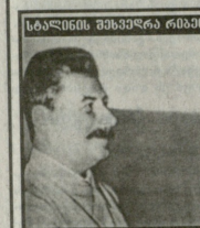
სარწმუნოა მსხვერპლ რანარტიკონი

მთხმის ქვეყნის განმარტლებსა და შიორების მიწების პრტი სარწმუნოა პატი - ძაჲსი უსარწმუნოა