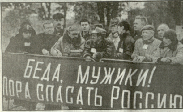
მთი უღატი, რუსეთი გადაარჩინონ, მაგრამ რაბოტაჲს რაღსაზა წაზიან პრეზიდენტი ლიდერების და თხოზიანის შერ დასახულ ვაჭარ ადრე დაიწყო საჯარო შეხვედრის ანტიარსიერეთის (რუსეთი) ქალაქებსა და სოფლებში. მთხედა ის, რაც უნდა მოხდეს, საფინისი