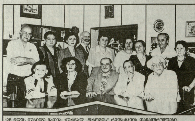
125 წლის იუბილე ბათინ: შარანდ „დროსა“ რედაქციის თანამშრომლები.