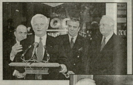
ნ. ბ. - 3 გვ.

თბილისში გაიხსნა წარმომადგენლობა. მნიშვნელოვანი საერთაშორისო პროექტები ვერ განხორციელდებიან, „შევირის“ გაბედული ნაბიჯები რომ არა.