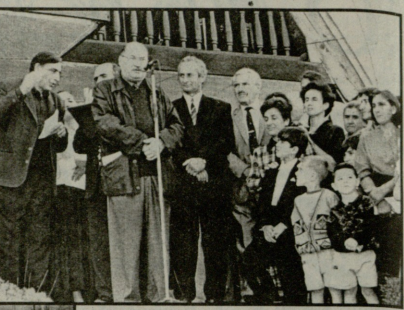
საქართველოს რესპუბლიკის პრეზიდენტის განკარგულებით, ნოდარ დუმბაძის უხიმი მხარული მშობლიური კუთხეში...