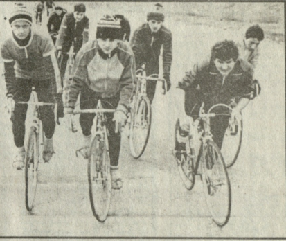
სპორტის სახელმწიფო დაპირებები...