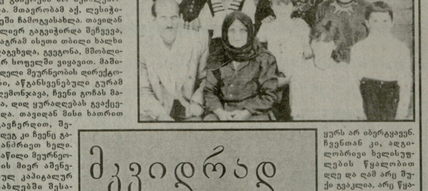
ყურს არ იხერხებენ. ჩვენიან კი, ადგილობრივი ხელისუფლების წევრები...