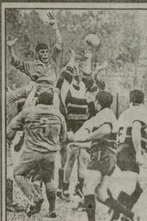
ამჟამად გურია და საქართველოს მთავრობის ერთობლივი ინიციატივით...