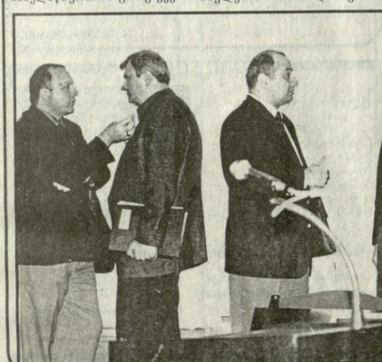
ელვარდ ალიბერიძე, საქართველოს პრემიერ-მინისტრი