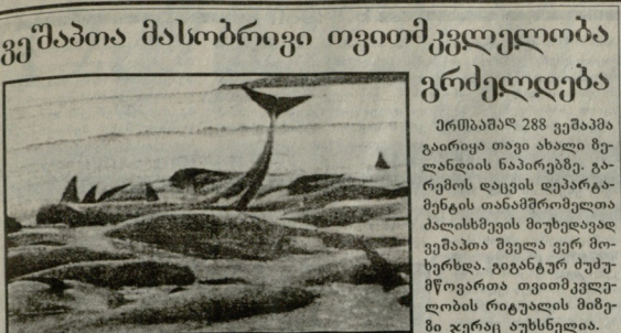
გეგმათა მასობრივი თვითმკვლელობა