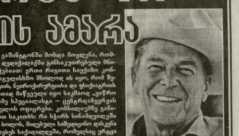
სამბავშვო ბავშვთა ცენტრის მენეჯერი