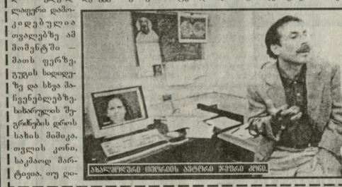
საბავშვო ბავშვთა ცენტრის მენეჯერი

ფეხი დამოს, სიჩქარეზე, კინი არ დასჯერდა მძღველებს და გადმავლდა თვლებს.