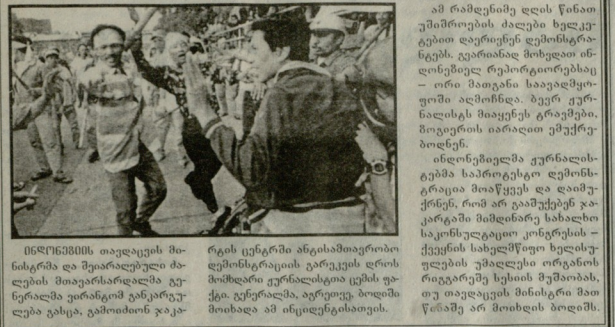
ბოდიშ იხდის ურუნალისტების ცემის გამო