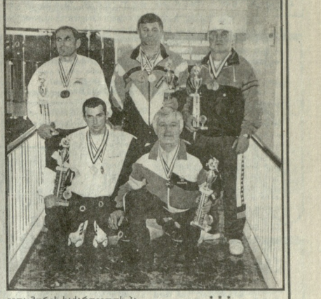
მთიანეთის სპორტული კლუბის წევრები... მთიანეთის სპორტული კლუბის წევრები...