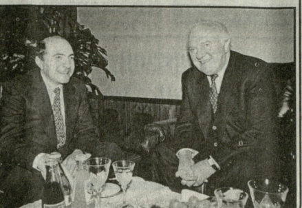
ნ. ბ. - 2 გვ.

„აფხაზეთში კონფლიქტის მოწესრიგების პროცესში რეალური შედეგის მიღწევას დრო დაეძგა“ - ამის შესახებ პრეზიდენტმა მიხეილ სააკაშვილმა განაცხადა. მისი განცხადებით, აფხაზეთში არსებული კონფლიქტი უნდა მოწესრიგდეს რეალური შედეგების მიღწევით. სააკაშვილის განცხადებით, აფხაზეთში არსებული კონფლიქტი უნდა მოწესრიგდეს რეალური შედეგების მიღწევით.