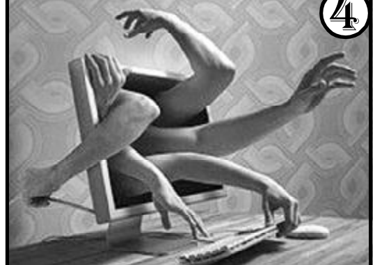
4 ყოფილი ხელისუფლება ნახმოქრობის რეინკარნაციის მიზნით კვლავაც ტოტალურად უსმენს ყველას?

ამბავი ქალღღებით 6 ბიურო-კრტიული გუნდამობისა