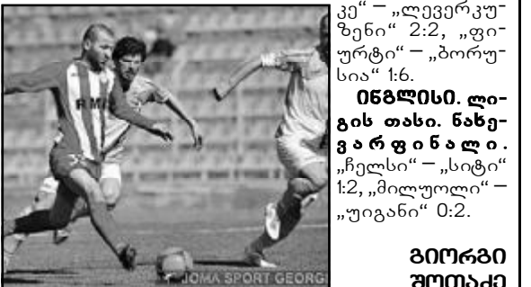
იბრაჰიმი, „მილანი“ - „ნაპოლი“ 1:1, „ტორინო“ - „რომა“ 1:2, „ატალანტა“ - „ფიორენტინა“ 0:2.

სატურნო მდგომარეობა: „დინამო“ - 63, „დილა“ - 59, „ტორპედო“ - 54, „ჩიხურა“ - 50, „ზესტაფონი“ - 39, „ბაია“ - 36 ქულა.