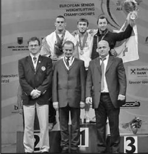
მი აკრა და ორჭიდში 366 კილოგრამით პირველი ადგილი დაიკავა. ამჯერად ცირეკიძემ საბოლოო ჯამში 4 კილოგრამით მეტი მოაგროვა (165+205=370), მაგრამ მესამე

მიდან მხოლოდ ერთი ცდა გამოიყენა და 180 კილოტი მეოთხე იყო. აკრაში ამ კვარტეტს კუზილოვი გამოაკლდა - საწყისი წონა 216 კილოგრამი ვერ დაძლია.