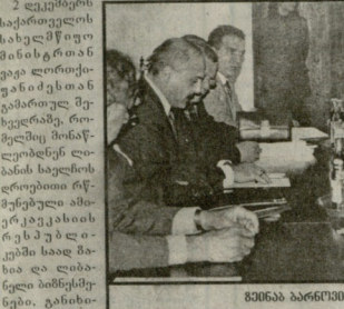
ბიზნეს ბარონის ფოტო.

სახელმწიფო მინისტრი ლიბანელი ბიზნესმენები დაინტერესდნენ ლიბანის საქმიანი წრების წარმომადგენლები დაინტერესდნენ არაბულ ქვეყანაში ურთიერთსარგებლო ურთიერთობების დამყარების საკითხით.