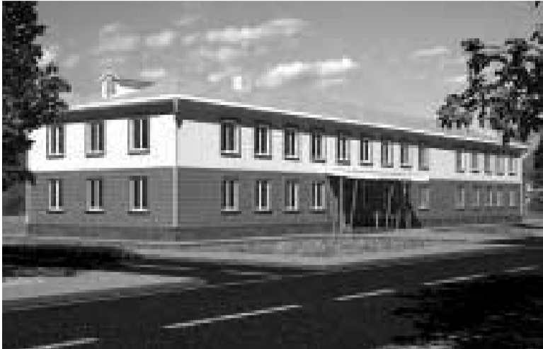
სოფალი წინამძღვრიანთა: უკველიანი ქართული სასოფლო-სამეურნეო სასწავლებლის რეაბილიტაცია

ქართველი საზოგადო მოღვაწის, ილია წინამძღვრიანის მიერ დაარსებულ კოლეჯს ძველი იერი უბრუნდება და მის კედლებში სწავლა განახლდება.