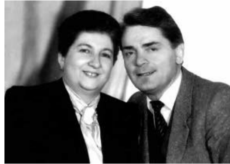
დედა და მამა