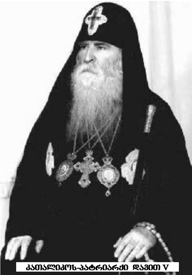
პატრიარქი ილია II