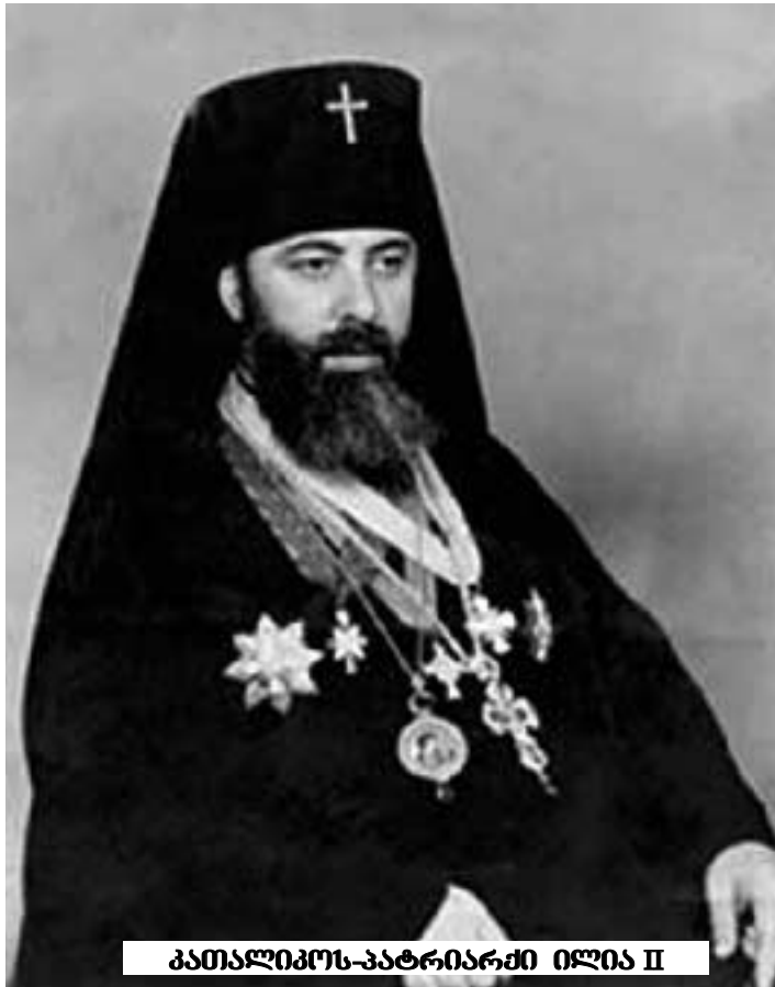
პატრიარქი ილია II