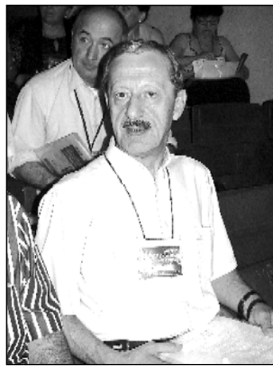
მოქმედი არ ხარ, შესაძლებელია სხვადასხვა სახის დასკვნები დაიდოს.

თმა უწყის, მართალია თუ არა, ჯერჯერობით არაფერი ცნობილი არ არის. ძალიან მნიშვნელოვანი იქნება ის, თუ რა მასალები ექნება კომისიას დადგენილი უკვე უტყუარი ფაქტების სახით. და შედეგად უკვე ამ ფაქტებზე დაყრდნობით, რა დასკვნები იქნება გაკეთებული. მოგეხსენებათ, ერთი დღე იმედი ფაქტებზე თუ მოუკვრი-