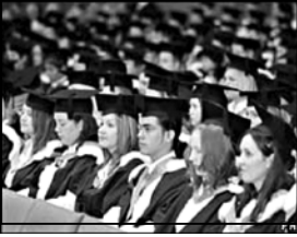
ყოველკვირეულმა „თაიის ედიუქეიშნა“ მსოფლიოს საუკეთესო უმაღლესი სსსპაფსსპა რეიტინგი გამოაქვეყნა.

გამოცემა, რომელიც ბრიტანული გაზეთის „თაიისის“ დამატებას წარმოადგენს, პლანეტის საუკეთესო უმაღლესი სსსპაფსსპა რეიტინგების სიაში 2004 წლიდან ადგენს. ამჯერად რეიტინგის შედეგებში 9386 მეცნიერული და უნივერსიტეტების აქსონინანდული კურსდამთავრებულების 3281 დამატარებლის აზრი გათვალისწინეს.