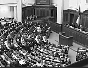
სახელმწიფო ბიუჯეტისა და თავისი თავდაცვისუნარიანობის საზოგადოებრივი რეგულაციები

უკრაინიდან წამოყვანილი საბრძოლო ტექნიკის დიდი ნაწილი უფრებით გამოდდა. ამის გამო თავდაცვის სამინისტროს რამდენიმე მუკაღმოსონი გიოსებს მიღმა აღმოჩნდა. ომ სხადების გამო უკრაინის არ უწერდნენ. ნერვიულობა მათ ავიციტის ომის შემდეგ დაიწყო.