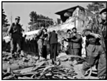
ავღანეთის შედეგად საელჩოს დაცვის სამსახურის სამი წევრი ნაზსაზღვრეობით დაიჭრა.