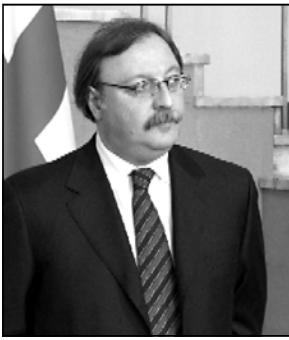
უაგ მარხვაი ე

ჩვენი საგარეო საქმეთა მინისტრი რუსეთის მოქალაქე ადარ არის