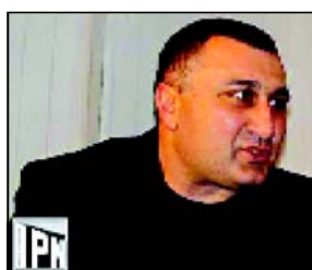
არ გვინდათ უფლება ასეთი ვარსკვლავები საქართველოში მოგვეჩივოთ?

დასაშინებელი და საქართველოში ჩამოყვანილი ოქიტაშვილი ვარსკვლავები და მსოფლიო დონის ხელოვნების, რომელიც ჩვენი საზოგადოებისთვის მანამდე დიდი სიახლეა იქნება. — კულტურის სამინისტროში