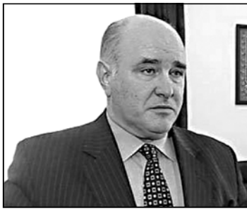
არანაირი „სტინგერები“ და „პელაგრიები“ არ გვეუბნებიან.

დას ანტიკატორული განცხადება აღარ უნდა ამოსულავს.